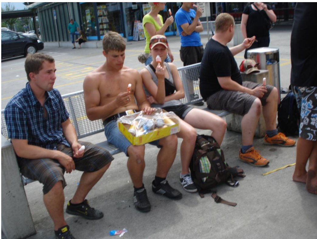
Auf dem Heimweg...