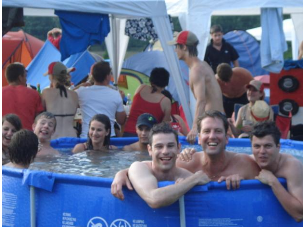
Nach den Wettkämpfen beim Sünnele und Bädele...