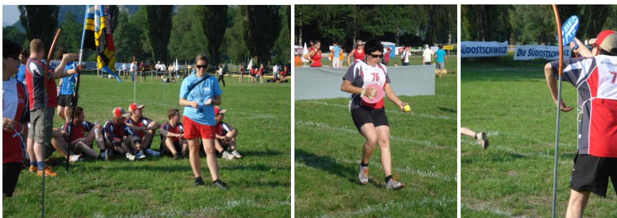
Die Aktivriege beim Fachttest...